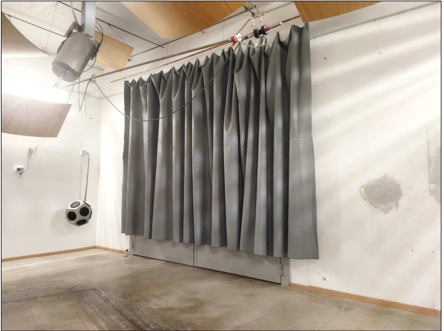
Fotografia dell'oggetto Photograph of item